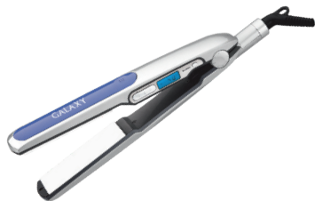
GL4507 ЩИПЦЫ ДЛЯ ВОЛОС