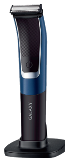
GL4221 ТРИММЕР ДЛЯ БОРОДЫ И УСОВ