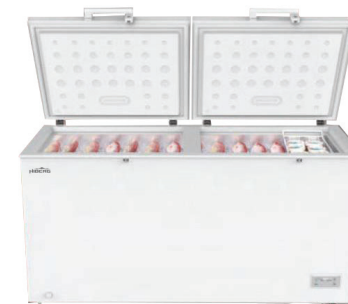
- Морозильные лари