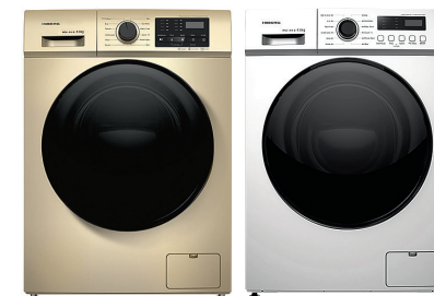
- Стиральные машины