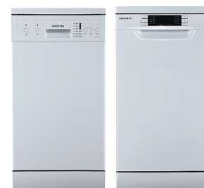
- Посудомоечные машины