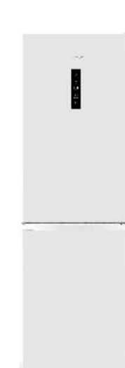
Двухкамерный холодильник NRK619FAW4