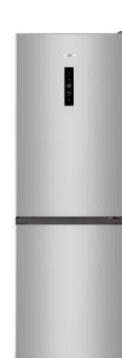
Двухкамерный холодильник NRK619FAS4