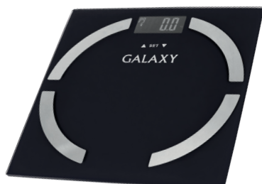
GL4850 ВЕСЫ МНОГОФУНКЦИОНАЛЬНЫЕ ЭЛЕКТРОННЫЕ