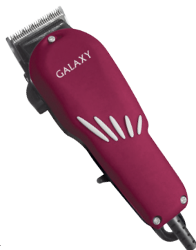
GL4104 НАБОР ДЛЯ СТРИЖКИ